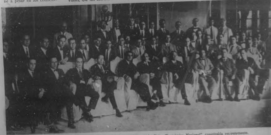
Distinguidas personalidades que forman la Directiva de la "Agrupación Cívica Económica Nacional", constituida recientemente.