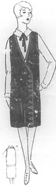
Traje de terciopelo con carisma de georgette.

Cándida. Madre joven. Inés. Les transcribo algo muy interesante y que no deben olvidar: "Aunque ambos cónyuges son igualmente responsables de la educación de los hijos..."