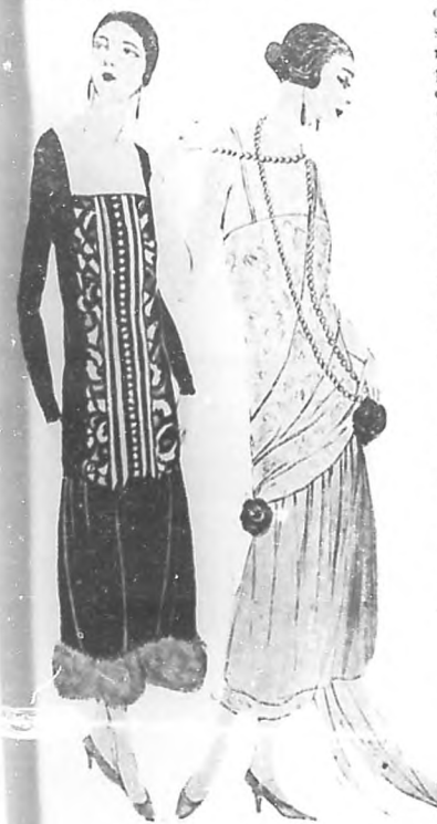
Modelo vistoso de seda, con bordados en metal. Otro modelo de crepé de China con bordado en la cintura y vuelta de pluma, en el mismo tono. En colores pálidos, para de noche.

Después de pensar en Dios, contemplando y considerando sus obras y de practicar la caridad, nada hay que emboblece el alma como la propia satisfacción de poder realizar la belleza, de verse hacer por de una obra de arte, de sentirse artista. El mármol trabajado por el escultor, los colores combinados por el pintor, los materiales de construcción dispuestos por el arquitecto en hermoso edificio, los diversos sonidos armonizados por el músico, las palabras en correcta construcción pronunciadas o escritas por el orador, el literato, el poeta... todo ello da por resultado obras de arte, causando en el artista una emoción profunda y gratísima, que no cambiará por todos los tesoros del mundo. Por que animando la muerta materia, se dignificó su alma, que es casi transportada a otra esfera más elevada, más unida a Dios. Artista de las artes.