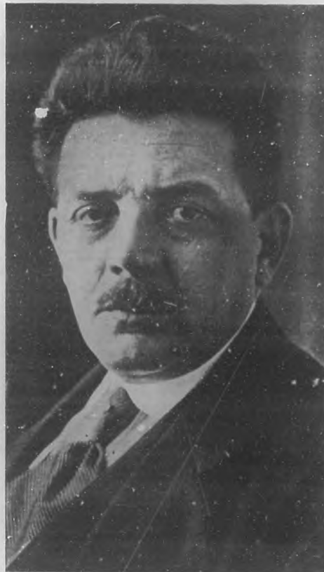
M. EDUARD HERRIOT Ilustrador político y literato francés.