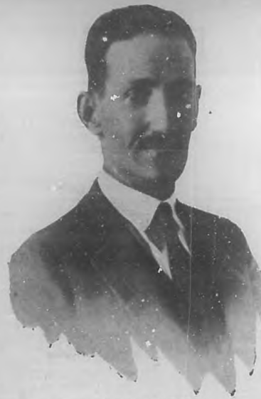
DR. ALBERTO RECIO Eminente bacteriólogo, Catedrático de la Escuela de Medicina.

luminosa exposición de la experiencia cubana acerca de la transfusión sanguínea, en el transcurso de ocho años consecutivos. Durante ese lapsus los Dres. Recio y Figueras realizaron 480 transfusiones de sangre, obteniendo en casi todos los casos un éxito ro-